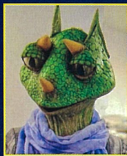
??? 職業怪人カメオール