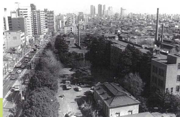
昭和50年頃の蚕糸試験場の様子